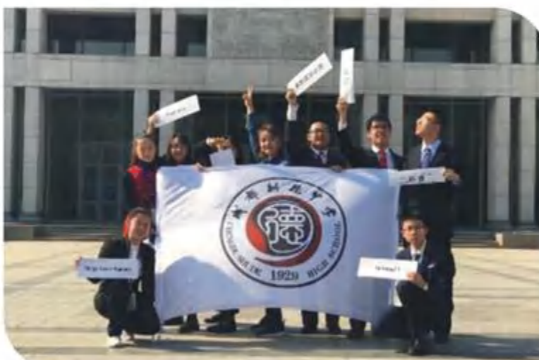
2018年参加北大模联合影