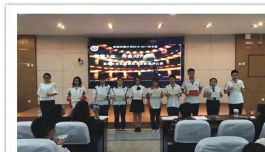
2016级暑期社会实践演讲大赛