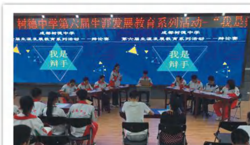
第六届生涯发展教育系列活动——高二辩论赛