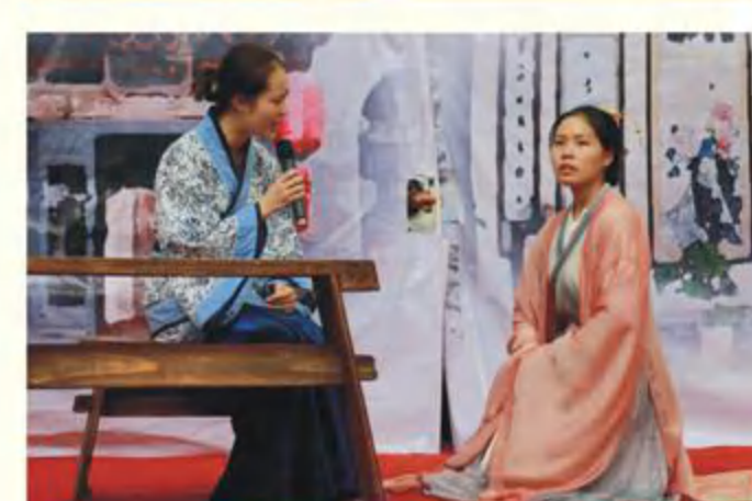
The Peacock Flies to Southeast