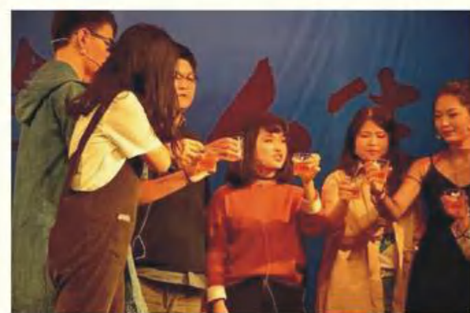
《毕业十年后的同学会》