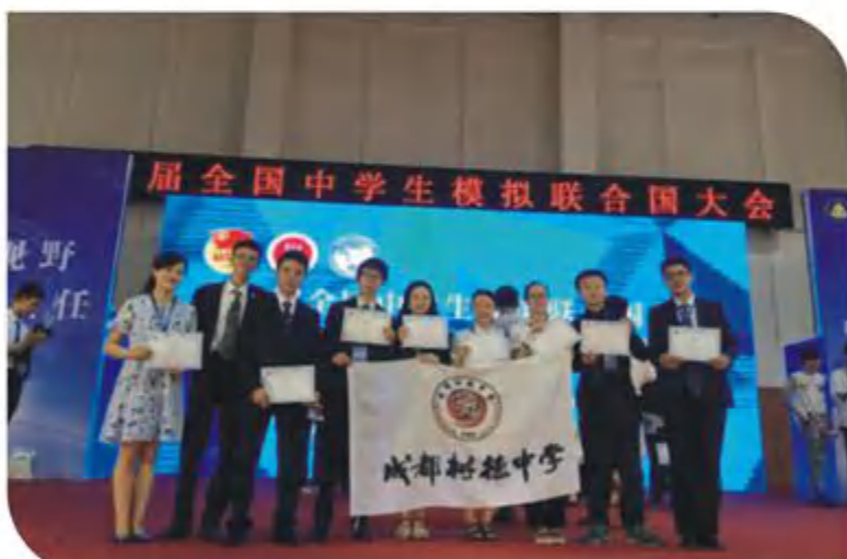
2017年参加全国中学生模拟联合国大会合影