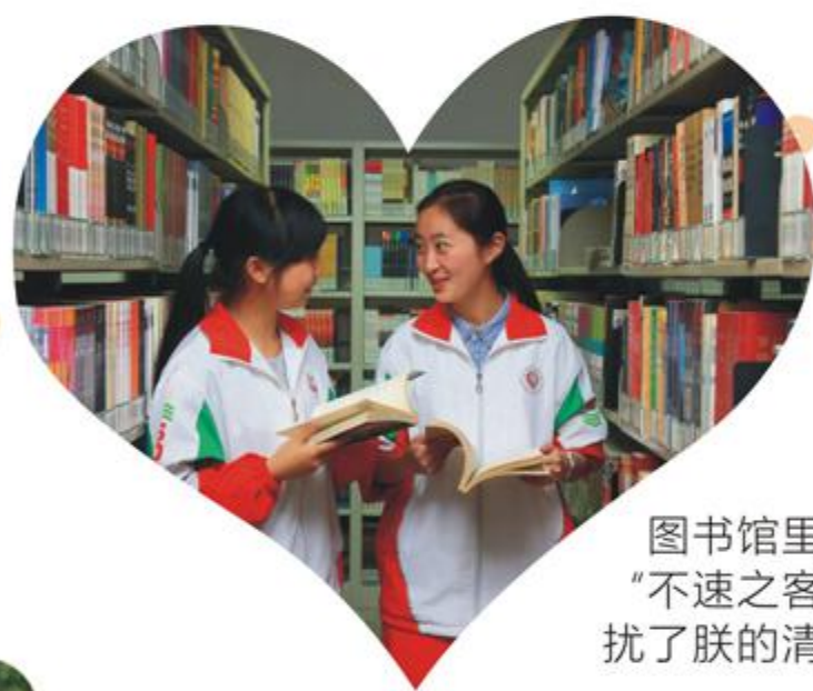
图书馆里的“不速之客”，扰了朕的清闲。