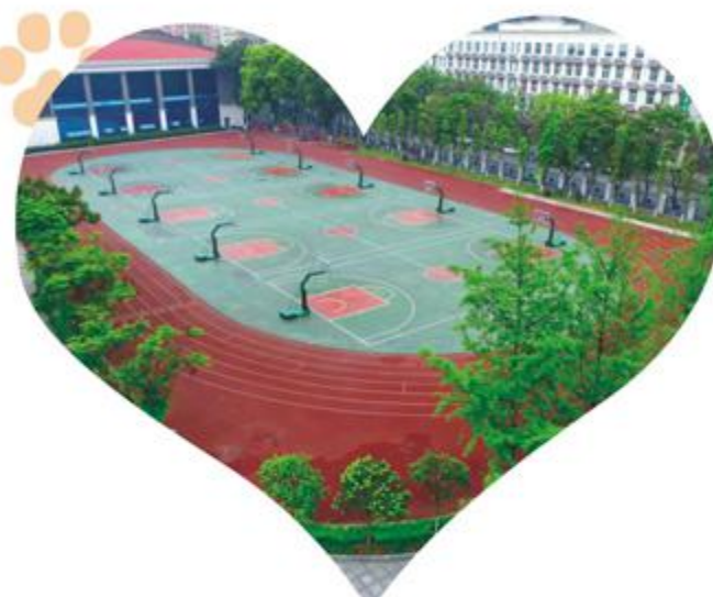
三楼天台所见朕的江山一角。