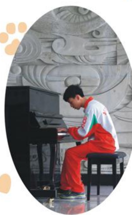
在艺术楼观看皇家钢琴师solo