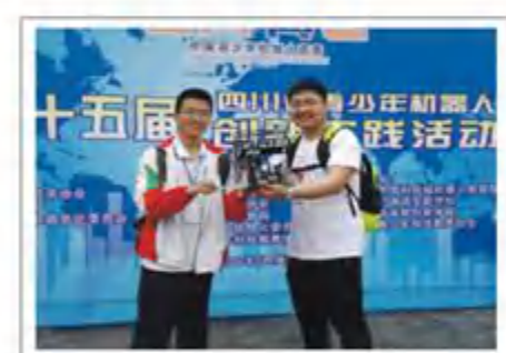
2017四川省青少年机器人创新实践活动冠军