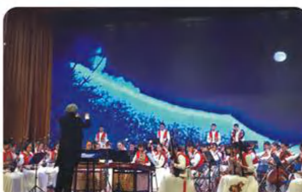
民乐团2016年参加市直属器乐比赛获一等奖