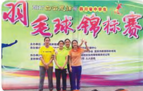
2017年四川省中学生羽毛球锦标赛高中女子团体冠军