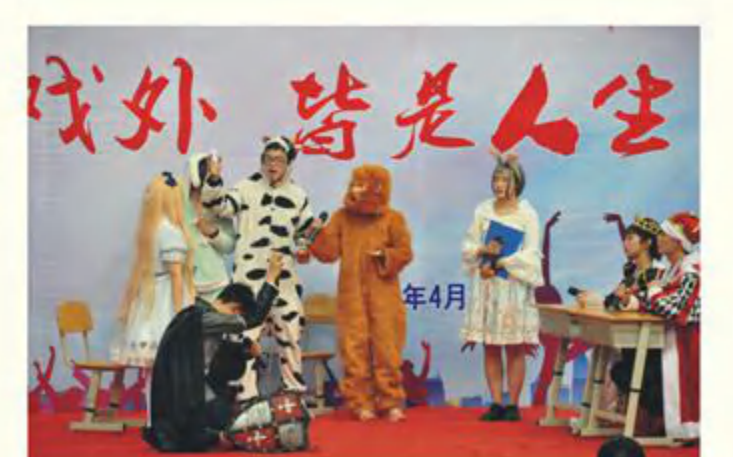
Alice in Wonderland