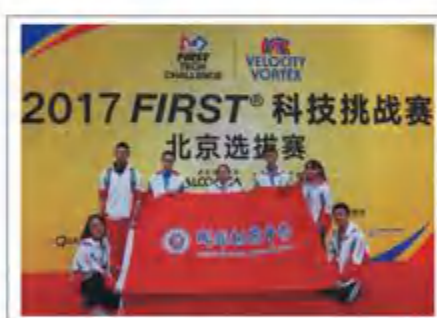
2017 FTC冠军 1376战队成员

2005年3月，树德中学机器人队成立，至今已历时12年。从建队初的2名队员，到如今的20余名队员。