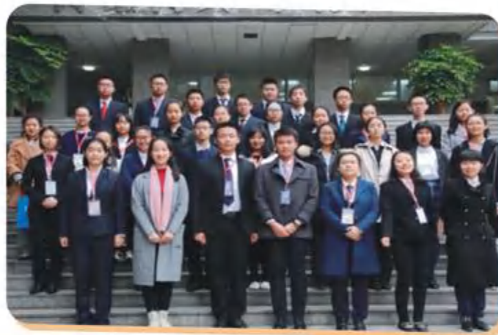
第十届树德模拟联合国大会合影

过去的一年里，英国脱欧艰难推进，中美元首会晤举世瞩目，难民问题困扰着欧洲大陆和整个人类社会。我们有着热爱学术关心天下事的真心。锤音叩响，一张张国家牌高举在空中，一个个身着黑色西装的身影，一颗颗炽热有严谨的心，在树德烙下深深有力的印记。