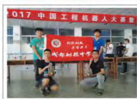
2017中国工程机器人大赛全国冠军