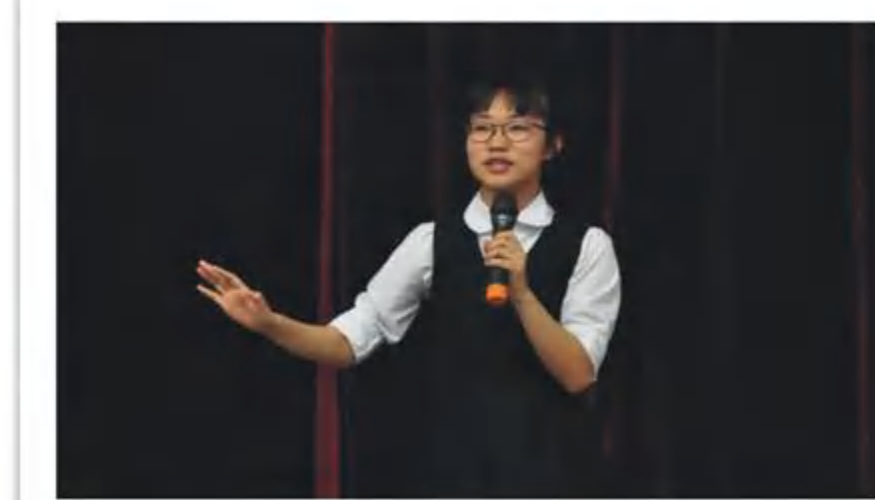
2016级“我的偶像”主题演讲比赛