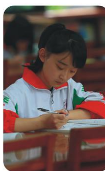
阅览室散步消食捕捉到认真学习的小姐姐。