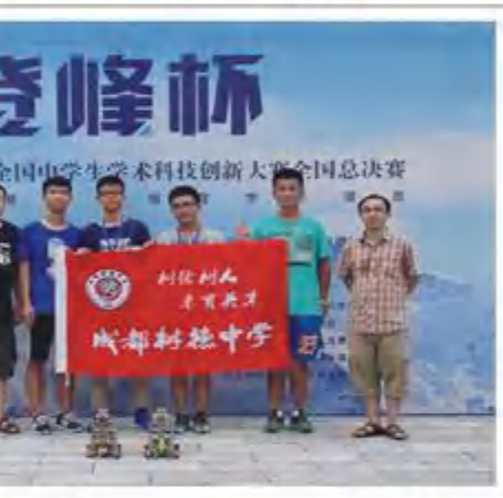
2017登峰杯全国总决赛一等奖