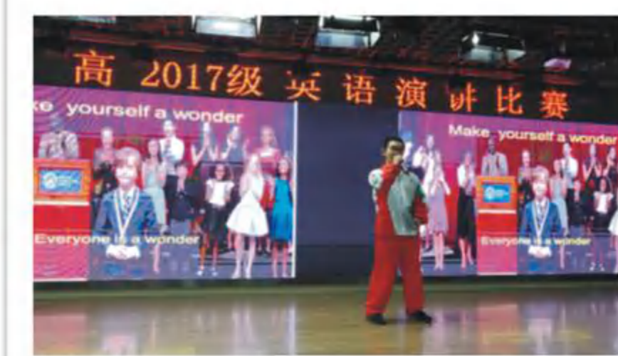
高2017级英语演讲比赛