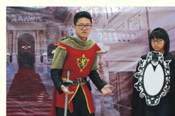
Looping in love