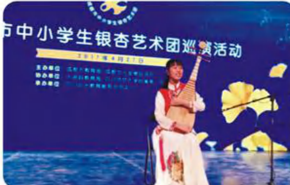
民乐团参加2017年成都市中小学生银杏艺术团巡演活动